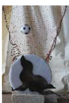
2015, de zeehond één van de moeilijkste doelen